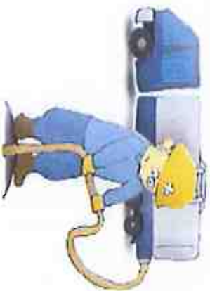
浄化槽清掃技術者